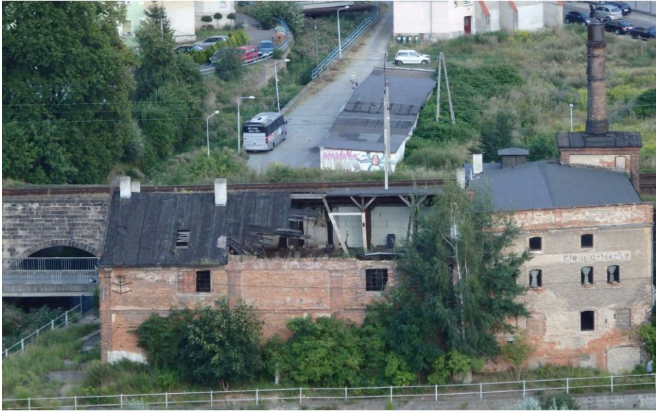
Abb. 11 Auf dem Foto aus dem Jahr 2006 sieht man den Verfall der Gebäude.