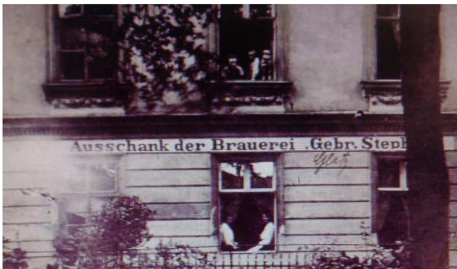
Abb. 8 Ausschank der Brauerei Gebrüder Stephan in der Rossstraße in Glatz.