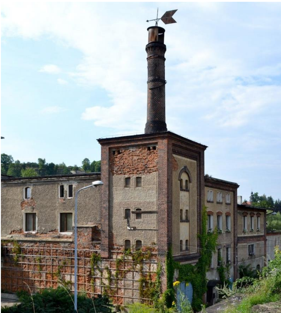
Abb. 12 Die ehemalige Mälzerei in schlechtem baulichen Zustand im Jahre 2006.