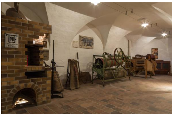
Oben: Die ehemalige Mälzerei

Seit dem Jahr 1979 hat es sich der Förderverein Fränkisches Brauereimuseum in der Bierstadt Bamberg e.V. (FBM) zur Aufgabe gemacht, das Brauchtum der Brauer, Mälzer und Büttner zu pflegen und dem Besucher die technische, wirtschaftliche und kulturhistorische Bedeutung des Brauwesens in Franken zu vermitteln. Die fast 400 Mitglieder bestehen aus Brauern, Experten und Bierliebhabern. Auch wenn man von einem regen Vereinsleben sprechen kann – Nachwuchs ist immer willkommen.