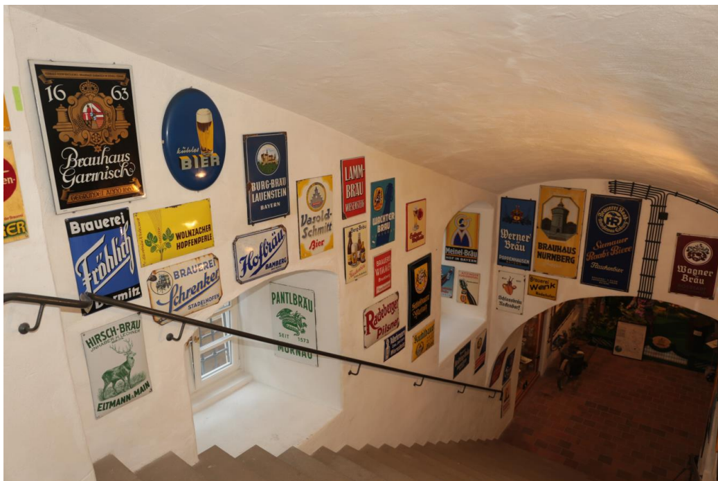
Mit einer Sammlung von Emailschildern mit Bierwerbung ist die Treppe zum Untergeschoss gestaltet.