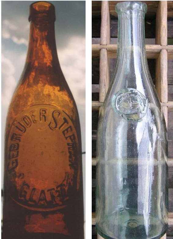
Abb. 5, 6 Flaschen aus der Kreuz-Brauerei der Gebrüder Stephan, links ca. 1890, rechts ca. 1870-1880.