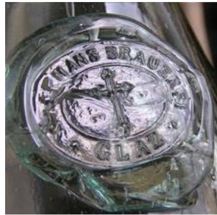
Abb. 7 Vergrößerung der Beschriftung in Abb. 6: „Stephans Brauerei Glaz“, mit dem Kreuz, das der Brauerei den Namen gab