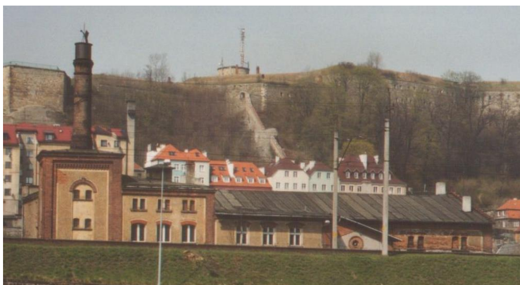
Abb. 10 Um das Jahr 2000 wurden die Gebäude der Mälzerei und die Lagerkeller noch als Lager genutzt und befanden sich im guten baulichen Zustand. Die Darre wurde 1897 durch die Firma Topf aus Erfurt umgebaut.