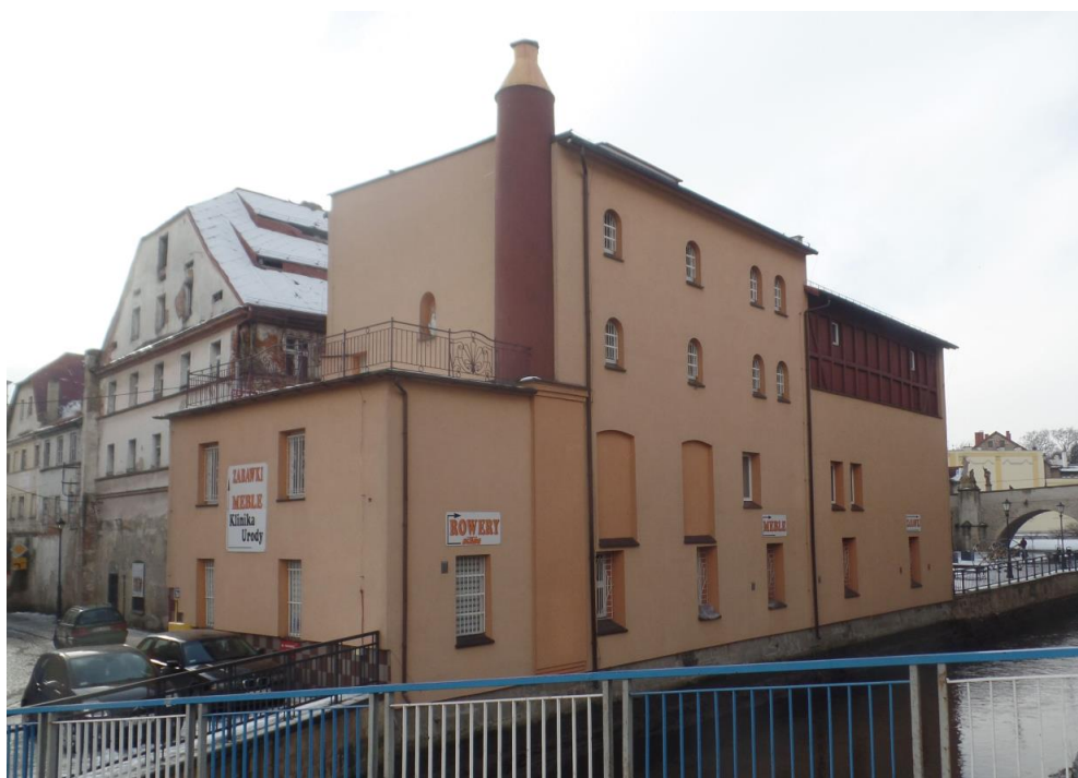
Abb. 9 Gasthaus und Brauereigebäude im Jahr 2019. Das Brauereigebäude wurde aufwendig restauriert und beherbergt heute einen Laden. Das Gasthaus (links daneben) wurde nach dem zweiten Weltkrieg noch bis in die Neunzigerjahre des 20. Jahrhunderts betrieben, heute ist es baufällig.