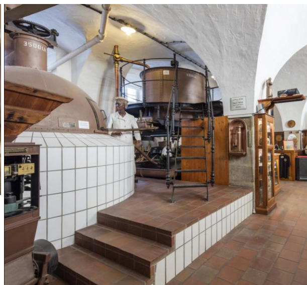
Rechts: Altes Kaspar-Schulz-Sudhaus aus der Brauerei Goss, Deuerling

Traditionell trifft man sich an jedem ersten Sonntag im Brauereimuseum zum Stammtisch, um sich bei einem Seidla auszutauschen. Und es wird immer wieder über den Krugrand geschaut: Zweimal im Jahr erkunden die Mitglieder auf ihren Ausflügen nach Tschechien, Südtirol u.v.a. Bierkultstätten. Da trifft man durchaus auch mal auf einen Berieselungskühler in Aktion. Auch die inaktiven Mitglieder bleiben auf dem Laufenden. Die regelmäßig erscheinende FBM News informiert Mitglieder, Freunde und Förderer über Termine, stellt Brauereien vor, thematisiert Brautrends.